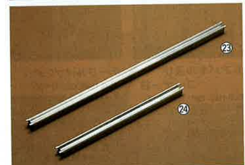
18-8テーブルトップタイプアダプターバー