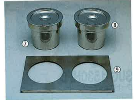
⑥18-8インセットポット

※SH-254 ボール1個 (穴径395mm) ※SH-1214 ポット4個 (穴径115×90mm) 使用 ※テーブルトップタイプは使用不可