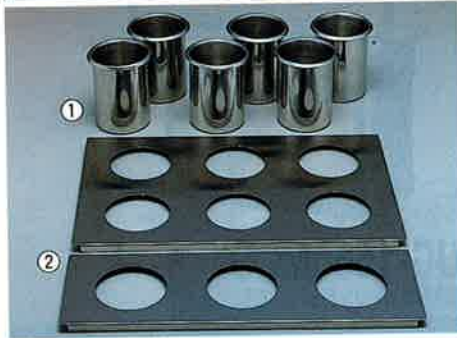
①18-8ドレッシングポット (マリポット)