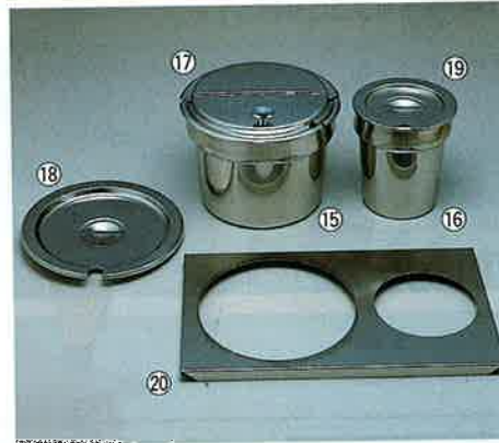
⑮18-8インセットポット

SF-1017PTW 508×303(穴径φ212mm) 板厚：1.0mm ※SH-1017 2個使用