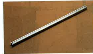
⑩18-8コールド槽用アダプターバー

※1500タイプのコールドトップユニットに2個使用 ※エコノミータイプにはオプションになります。 テーブルトップタイプには使用できません。