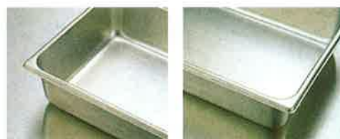
フラットで強度が増したふち。