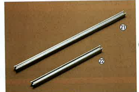
18-8ウォーマー槽用アダプターバー

SF-1020POW 508×303(穴径(大)φ260mm、(小)φ167mm) 板厚：1.0mm ※テーブルトップタイプには使用できません。 ※SH-1020・SH-1014 スギコインセット各1個使用