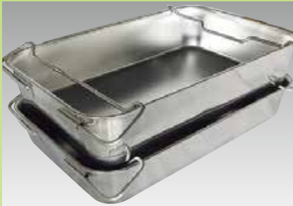
ハンドルを使用しての積み重ね