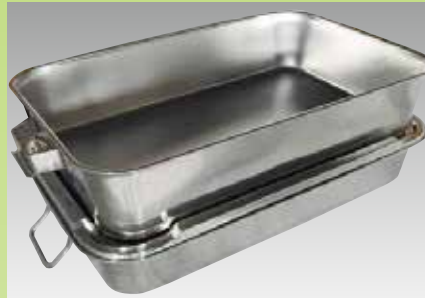
フタ(別売)を使用しての積み重ね