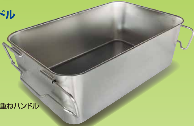
積み重ねハンドル